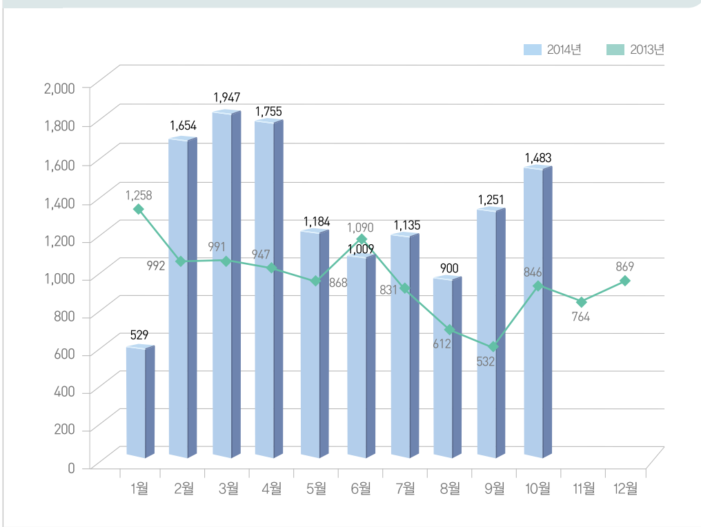
[그림 2] 해킹사고 접수처리 건수 추이