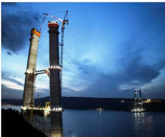
<보스포러스 제3대교 건설 사업>