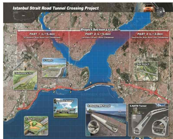
<이스탄불 해저터널 사업>